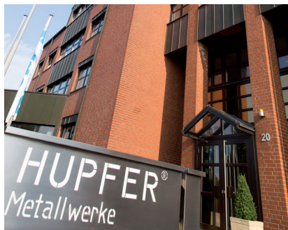
Ons hoofdkantoor in Coesfeld, Westfalen