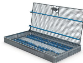
Safety first: de optimale bescherming van fijne en gevoelige instrumenten