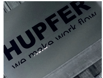
3-D, laser, robotics: bij ons dagelijks in gebruik