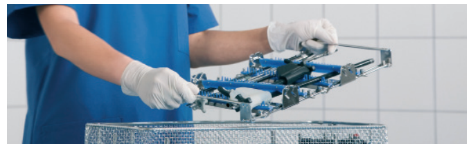
Alles heeft zijn plek: veilige bevestiging van de instrumenten, ook onderweg

Wie de praktijk niet kent, kan ook geen producten voor de praktijk produceren. Wij zijn in voortdurende uitwisseling met onze klanten want innovatie komt alleen door dialoog tot stand.